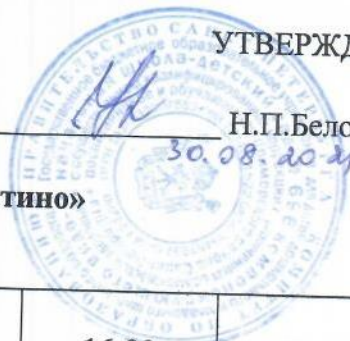
График влажной уборки в группе № 6 «Буратино»