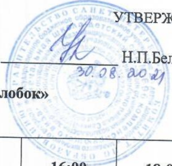
График влажной уборки в группе № 5 «Колобок» на _____ 2021 г