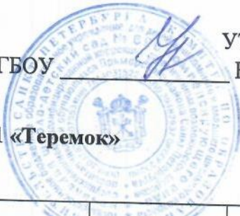
График влажной уборки группе № 1 «Теремок»